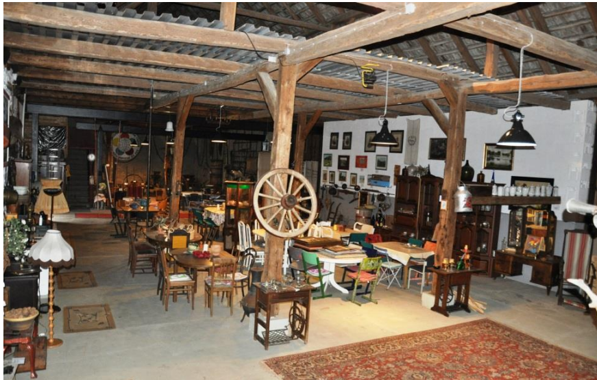
Durchfahrtsscheune - Innenansichten (Baujahr: 1855)