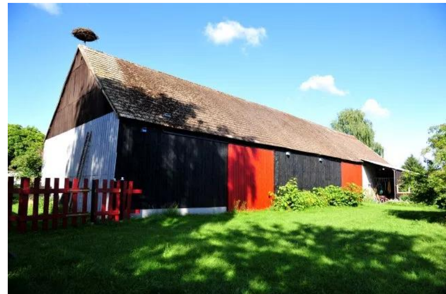
Durchfahrtsscheune - Außenansicht (Baujahr: 1855)

Interessenten, welche musizieren, künstlerische Leidenschaften besitzen und Raum für Ausstellung bzw. Auftritt suchen, gern sprechen sie uns an !