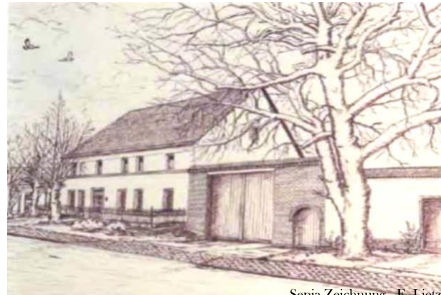
Dorfstraße 11 - Straßenansicht